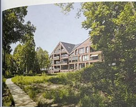
Kwartiercomplex in een bosrijke omgeving op Maurits Noord.

/ Despite economic adversities, the monumental barracks buildings were successfully preserved. Some are now used as commercial space, while others are lived in.