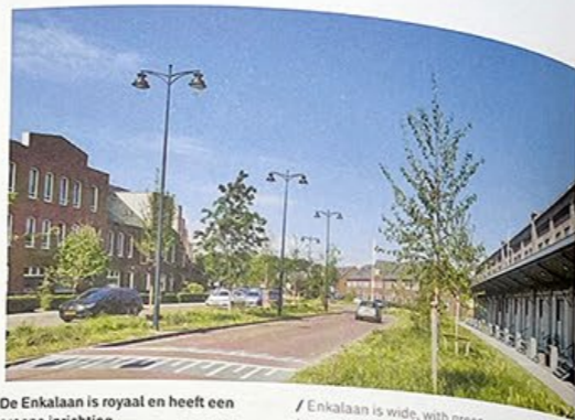
De Enkelaan is royaal en heeft een groene inrichting.

/ On the Enka factory site industrial elements, such as the old chimney, have been preserved.