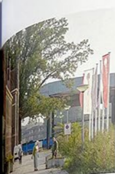
Zicht op het nieuwe station langs de monumentale Friskazerne, onderdeel van Maurits Zuid.

/ Behind the preserved wall of the former Enka factory lie secluded neighbourhoods.