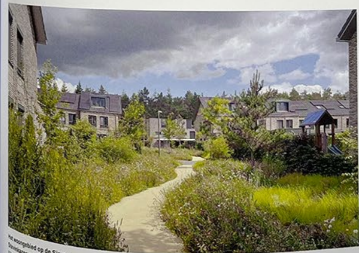
Het woongebied op de Simon Stevinkazerne kreeg een landschappelijke inrichting.

/ Small houses were built between the barracks buildings of Maurits Noord with spacious plant beds in the outer areas.