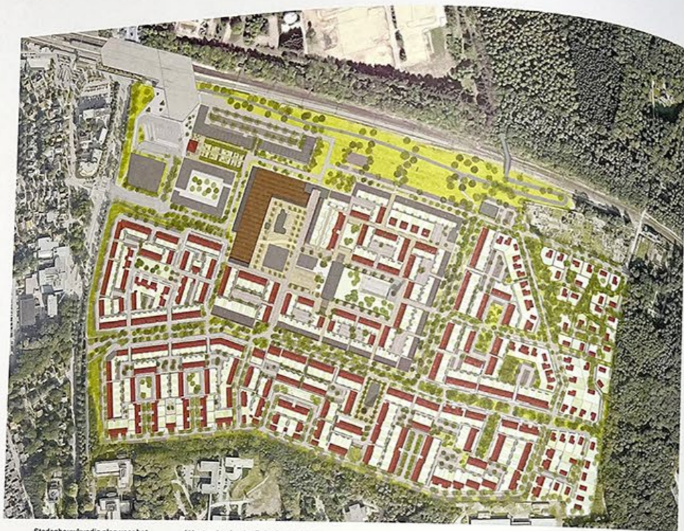
Stedenbouwkundig plan voor het Enkaterrein. / Masterplan for the Enka factory site.

PROJECT herontwikkeling kazernes- en fabrieksterreinen, nieuw treinstation