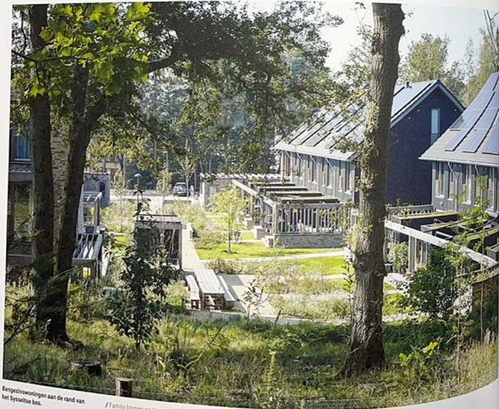
Eengezinswoningen aan de rand van het Sysseitse bos.

Residential development on the World Food Centre site, on the Maurits Zuid urban grounds, where food-related businesses will be located in the future.