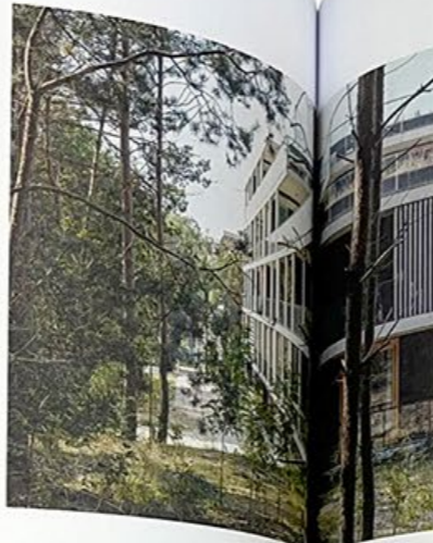
Woningbouw op het zogenoemde World Food Center, het gebied op Maurits Zuid waar in de toekomst aan landbouwgerelateerde bedrijvigheid komt.

The local firm Mix designed several of the buildings, including these flats on the Simon Stevin barracks site.