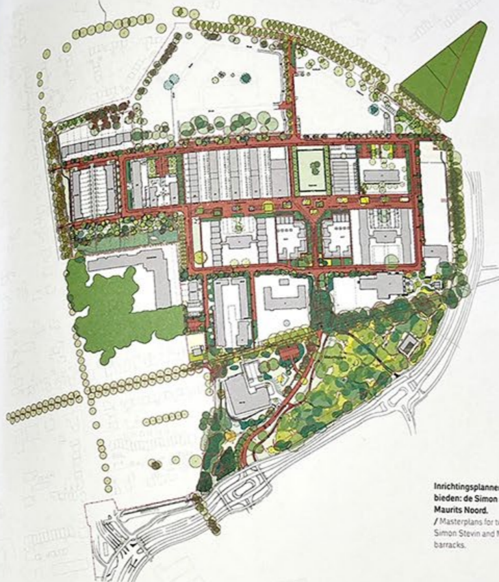
Inrichtingsplannen voor twee deelgebieden: de Simon Stevinkazerne en Maurits Noord. / Masterplans for two sub-areas: the Simon Stevin and Maurits Noord barracks.

KOSTEN tussen 600 en 650 miljoen euro (realisatie van vastgoed niet meegenomen)