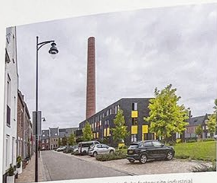
Op het Enkaterrein zijn industriële elementen bewaard, zoals de oude schoorsteen.

/ On the Enka factory site industrial elements, such as the old chimney, have been preserved.