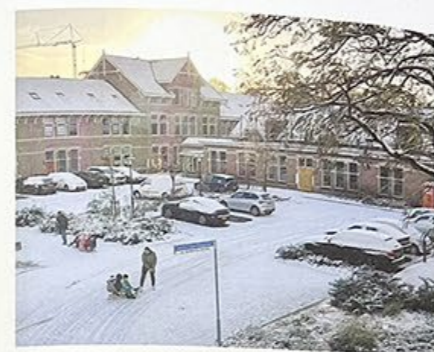
Ondanks economische tegenspoed is het gelukt om de monumentale kazernegebouwen te behouden. Sommige kwamen in gebruik als bedrijfsruimte, in anderen wordt gewoond.

/ View along the Maurits barracks barracks towards the new railway station.