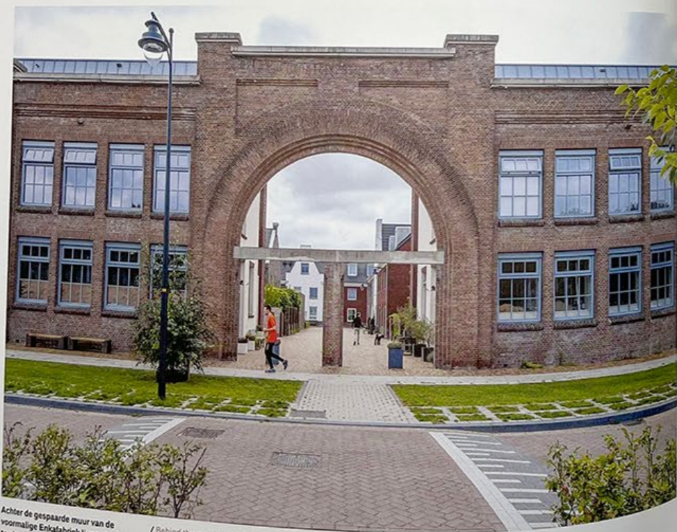
Achter de gespaarde muur van de voormalige Enkafabriek liggen besloten buurten.

/ Enkelaan is wide, with green landscaping.