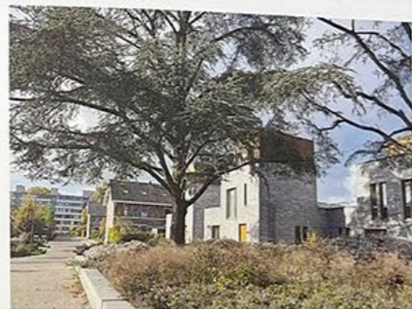
Tussen de kazernegebouwen van Maurits Noord kwam kleinschalige woningbouw. In de buitenruimte liggen ruime plantvakken.

/ Apartment complex in a wooded area on the Maurits Noord grounds.